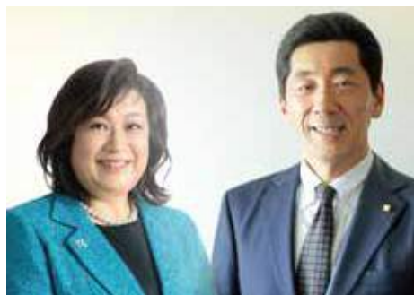
第24回女性経営者全国交流会実行委員長

*中小企業における労使関係の見解(労使見解):「労使の信頼関係こそ企業発展の原動力である」と企業づくりに対する考えをまとめたもの。1975年に中同協より発行されました。